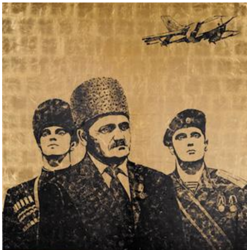
Рис. 2. Алексей Беляев-Гинтовт. «Ахмад Кадыров во время инаугурации»

На портрете «Ахмад Кадыров во время инаугурации» (Рис. 2) перед нами предстает совсем другой человек – повзрослевший, познавший горечь и скорбь потерь, обретший убеждение в собственной правоте человек.